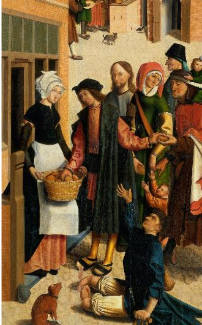
De zeven werken van barmhartigheid Meester van Alkmaar (Mat. 25: 42)

De laatste zondagen van het kerkelijk jaar staan traditiegetrouw stil bij teksten rond wat we 'Het Laatste Oordeel' noemen. Dat lijkt soms erg zwaar en daarom zou je ze willen overslaan. Ook de teksten van komende zondag kun je heel zwaar opvatten. Maar misschien kun je er ook iets uit leren. Deze zondag lezen we Ezechiël 34, 11-17 waar de profeet profeteert dat God zelf een herder zal zijn en zijn schapen zal redden. Daarnaast lezen we Mattëus 25, 31-46 waar duidelijk wordt wie Gods' sympathie hebben.