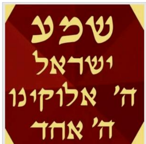
Het sjema (letterlijk: hoor!) is de joodse geloofsbelijdenis waarmee het monotheïsme begon: 'Hoor Israël, de Heer uw God is één'.

Het is dit jaar 70 jaar geleden dat de Wereldraad van Kerken werd opgericht. Tijdens de oprichting in 1948 voelde iedere afgevaardigde de spanningen in de wereld. De Tweede Wereldoorlog was weliswaar net afgelopen maar nieuwe spanningen (een wapenwedloop,