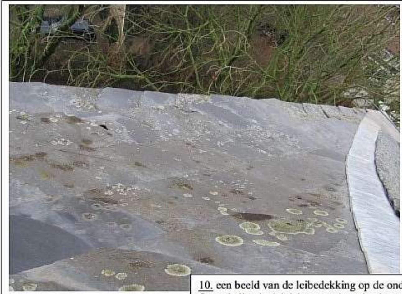
10. een beeld van de leibedekking op de onderste flauw hellende dakdelen noordwesthoek; zelfde omschrijving als bij foto 9.